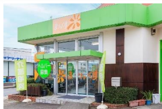
まりっくすサービスセンター本部