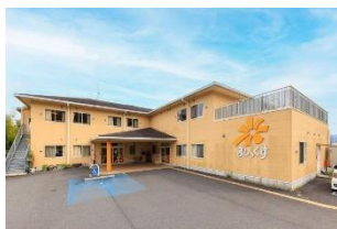
・シニアヴィラジュレ橋本 ・ジュレデイサービス