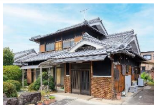
民家型デイサービスまりっくす