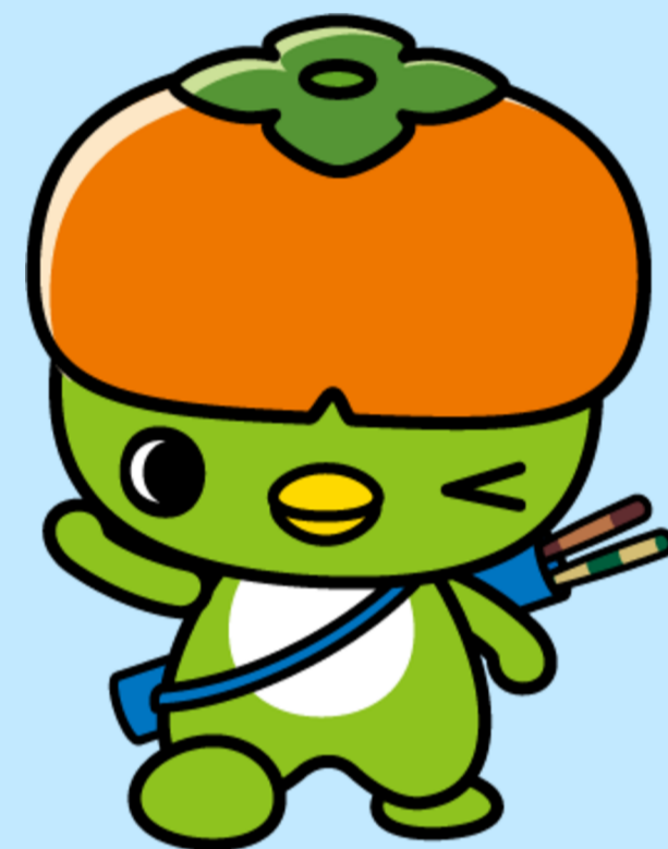
橋本市マスコットキャラクター はしぼう