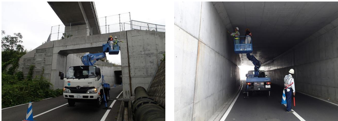
写真3-1 近接目視による点検状況