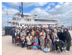
1号車の皆さん(ミシガンクルーズ)