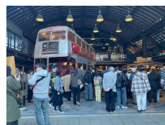
ラコリーナ近江八幡 (バームクーヘン製造見学の様子)