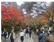
2号車の皆さん(石山寺と紅葉)