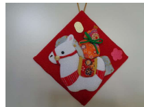
(部品の柄は見本とは異なります)