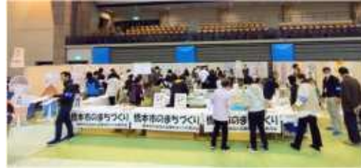
令和5年度すこやか橋本まなびの日出展