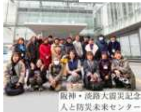
阪神・淡路大震災記念 人と防災未来センター