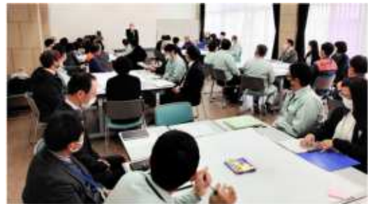
第2期 職員協働研修