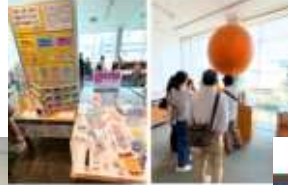
西館2階へ 防災・減災体験フロア