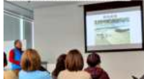
語り部さんより震災の 貴重なお話をうかがいました