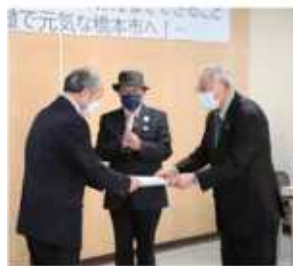
市長への提言書提出