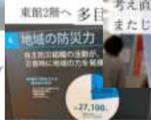
たくさんのパネル展示