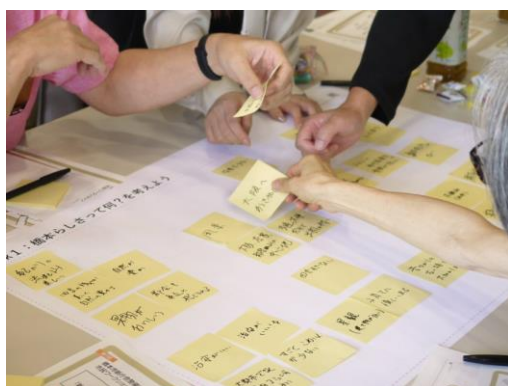
特徴・イメージ共有

また、同じ内容や似ているものを近くに貼付けてグループをつくり、枠で囲み簡単な標題をつけることで、橋本市の特徴・イメージをテーマごとに整理していただきました。