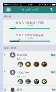
ランキング・バッジ獲得