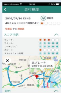
安全運転のヒント