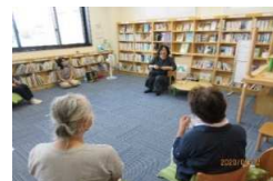
大人のためのほっこりおはなし会