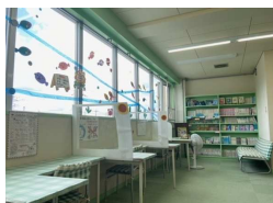
季節が感じられる図書室