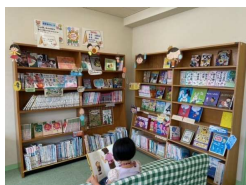
人気の新刊が並ぶ本棚