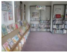
あかちゃんコーナー