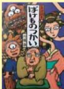
題名/ばけものつかい 作/川端 誠 出版/クレヨンハウス