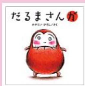
題名/だるまさんが 作/かがくいひろし 出版/プロンズ新社