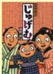
題名/じゅげむ 作/川端 誠 出版/クレヨンハウス