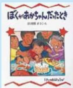
題名/ ほくがあかちゃんだったとき 作/浜田桂子 出版/教育画劇