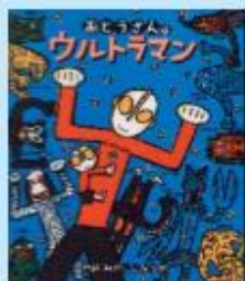
題名/おとうさんはウルトラマン 作/宮西達也 出版/学研