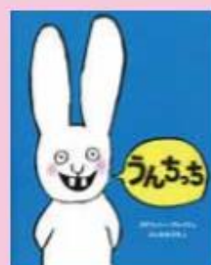
題名/うんちっち 作/ステファニー・ブレイク 訳/ふしみみさを 出版/あすなる書房