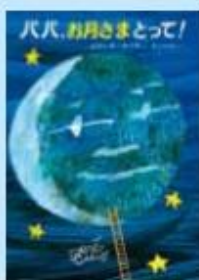
しかけ絵本です 題名/パパ、お月さまとって! 作/エリック・カール 訳/もりひさし 出版/偕成社