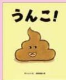
題名/うんこ! 文/サトシン 絵/西村俊雄 出版/文溪堂