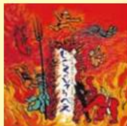
題名/じごくのそうべえ 作/田島征彦 出版/葦心社