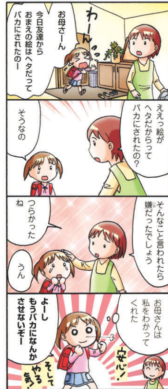
「子育てハッピーアドバイス」1万年堂出版 著者 明橋大二・イラスト 太田知子

そんなときもオロオロすることなく、「勉強やって意味あるんかって思うんやね~」「生きるってどういうことなんやろね~」と共感する気持ちだけを伝えてあげればいいのです。