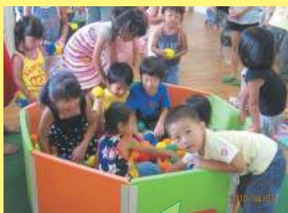
ボールプールに大はしゃぎ！

親子サークル「サンシャインどんぐりクラブ」は、日頃の活動が認められ、ニッセイ財団よりマット、遊具などが助成されました。8月3日に行われたお披露目会の様子を紹介します。