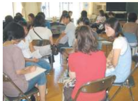
グループに分かれて、お母さん同志の交流ももちました。