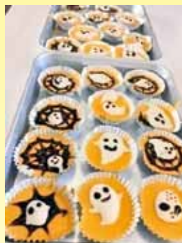
パンプキンムースの上に、 かわいいおばけがたくさん！ チョコペンと溶かしマシュマロ で描きました。