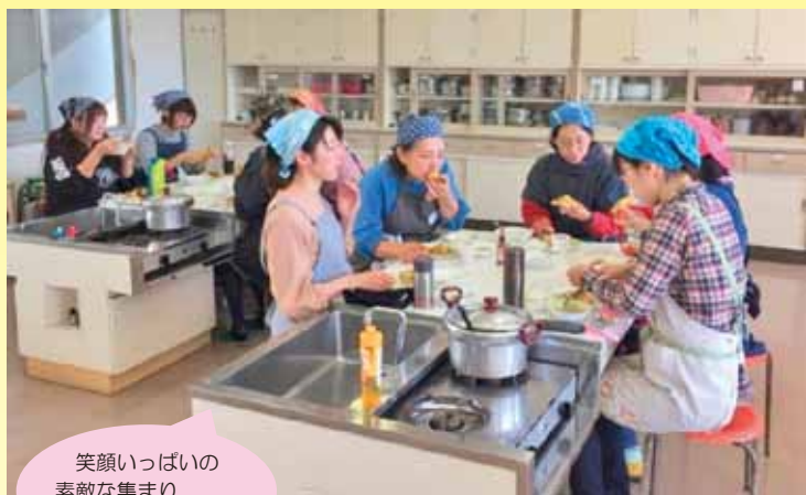
笑顔いっぱいの 素敵な集まり でした。

家族や仲間と会話を楽しみながらゆっくり食べる食事は、 ころもからだも元気にしてくれます。 ヘスティアの食育講座では、参加者のみなさんといっしょに、 わいわいおしゃべりしながら調理し、楽しく食べられるメニュー を考えています。