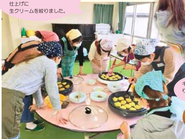
キャラメル りんごケーキ