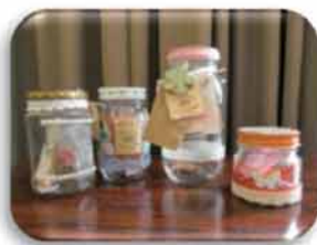
個性あふれるメモリージャー

オリジナルのメモリージャーに、HAPPYな出来事をメモして貯めていけば、幸せいっぱい素敵な宝箱のできあがり。