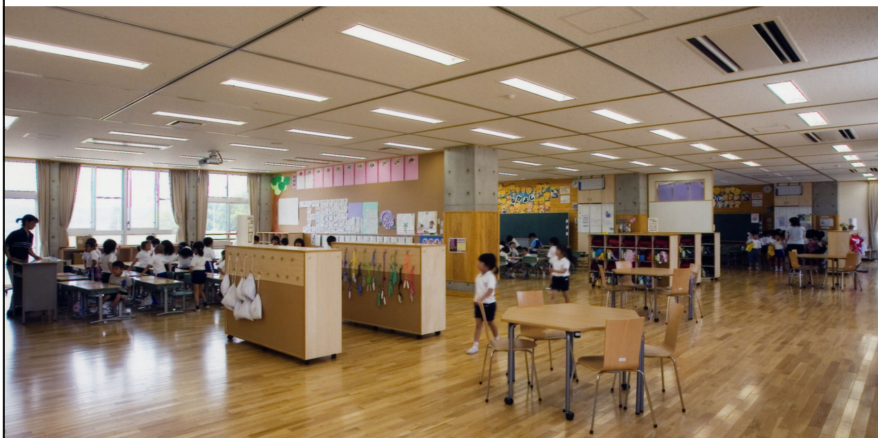
■ 泉小学校 教室に間仕切りがなく学年で1つの教室／CRとWSが連続