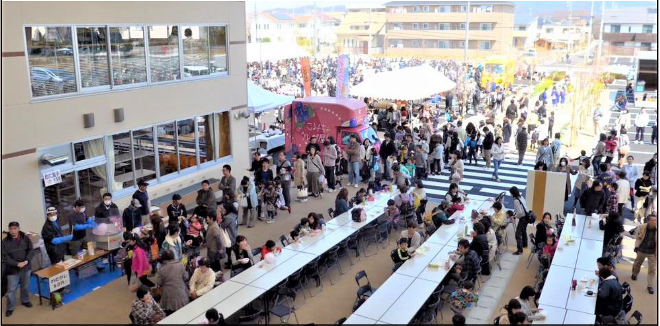
浄水中学校・交流館 屋根のある広場が地域の祝祭スペース