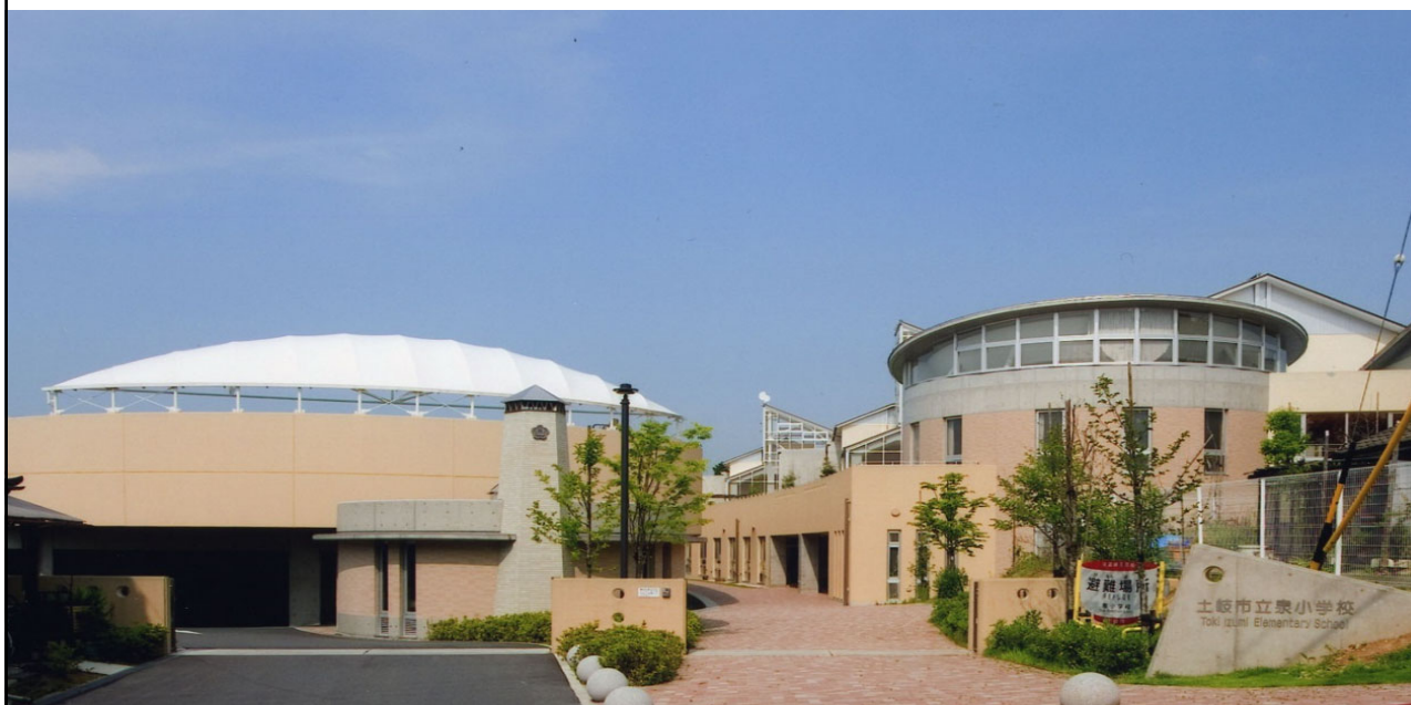
2006 土岐市泉小学校 地域学校連携施設を併設した地域に開かれた学校