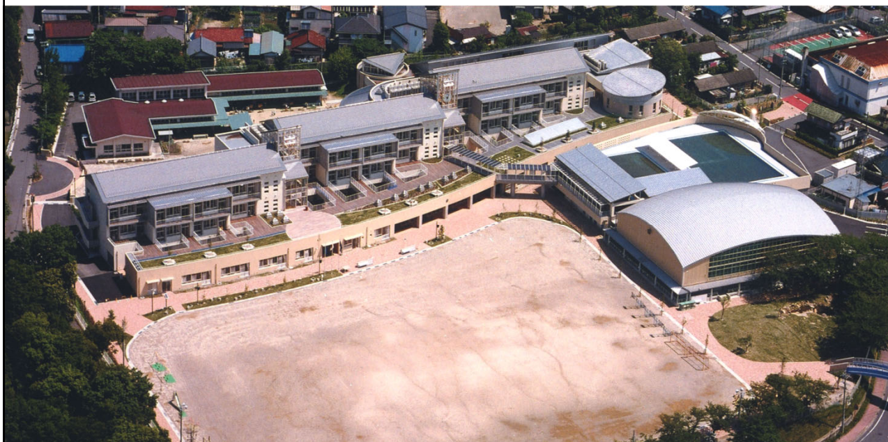
泉小学校 街の形式に嵌め込む／東西を貫く路地・等高線に沿う配置