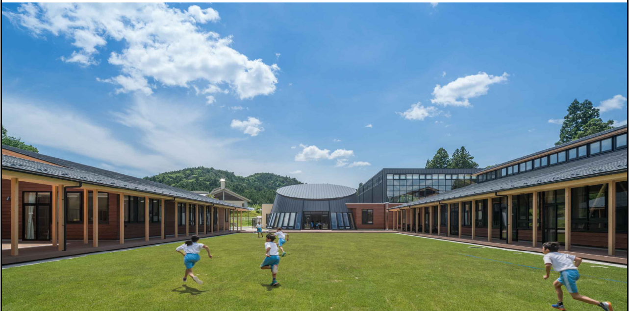
2017 新城市作手小学校 共育を実現する地域をつなぐプロセス