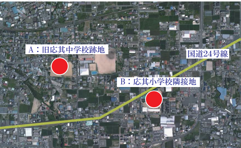
国土地理院の空中写真を加工して作成 出典：国土地理院ウェブサイト ( https://service.gsi.go.jp/map-photos/app/ )