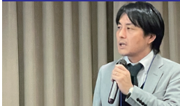
設計者による前提共有

第1回目では2つの移転候補用地について前提共有を行いました。 前提共有を受け新しい学校を考えるうえでの 第一印象 （ファーストインプレッション）の意見を出し合い、候補用地の印象を共有しました。