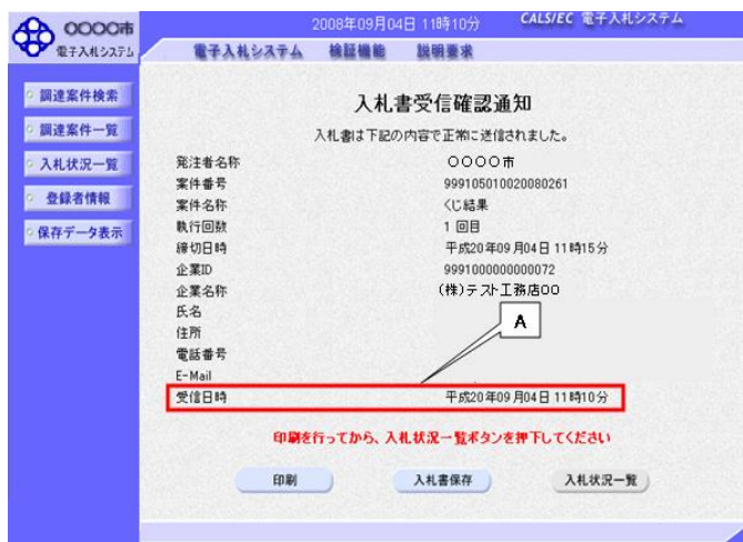
図1. 1. 入札書受信確認通知