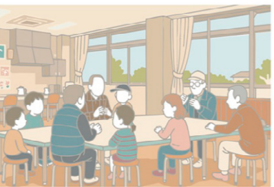
▲「共創空間」のイメージ

重点目標6 各学校に共有コーディネーターや多様なコミュニティが集える公共空間を配置し、学校と地域による協働の学びを強化する