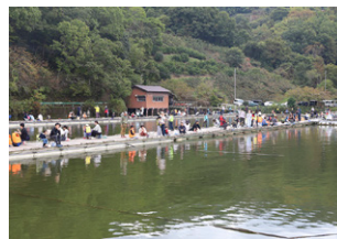
▲隠れ谷池でヘラブナ釣りを体験