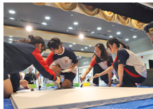
▲中学生が大きなキャンバスに橋本の未来を描きました