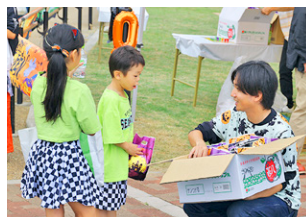
▲子どもたちにハロウィンのお菓子をプレゼント