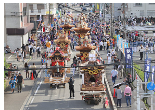
▲橋本だんじり協議会に加入している地区のだんじりが保健福祉センター東側道路に集結