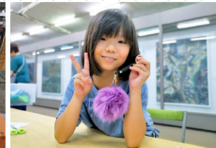
▲エコファードキーホルダーを手作り