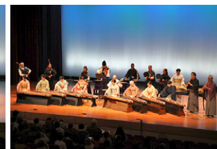
▲演奏会の最後は、和楽器との貴重なコラボレーション