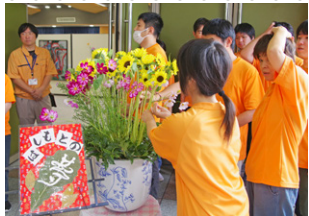
▲会場で「みんなで作るライプ生け花」を行いました