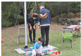
▲身長・体重・血圧などを測れる健康チェックブース