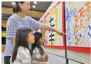
▲幅広い世代の皆さんのアート作品を会場内に展示