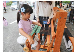
▲再織の体験コーナー