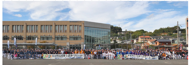
▲記念パレードに参加していただいた各地区の皆さん