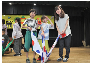
▲親子で大きな折り鶴を作る企画が大人気