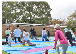
▲ヨガ体験で心も身体もリフレッシュ