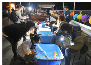
▲日が落ちた後は夜店やキッチンカーで楽しいひととき