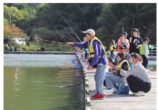
▲子どもも大人も一緒に釣りを楽しみました