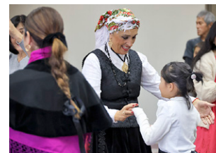
▲コンサート前に開催されたワークショップでは、スペイン・ガリシア地方の伝統楽器や歌・踊りを参加者が体験