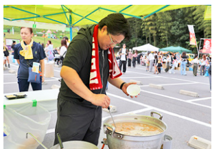
▲身体に優しいごはんやオーガニック食品などを販売