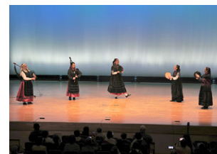
▲スペインから来たミュージシャンによる演奏