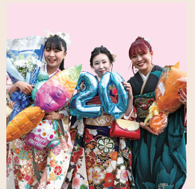
県立橋本体育館で開催された「20歳のつどい」に出席した皆さん。