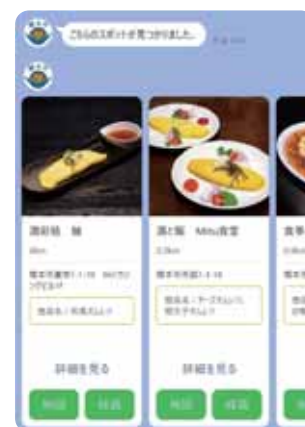
▲はしもとオムレツの検索結果