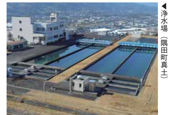
浄水場（隅田町真土）