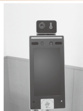
▲今回整備された検温器