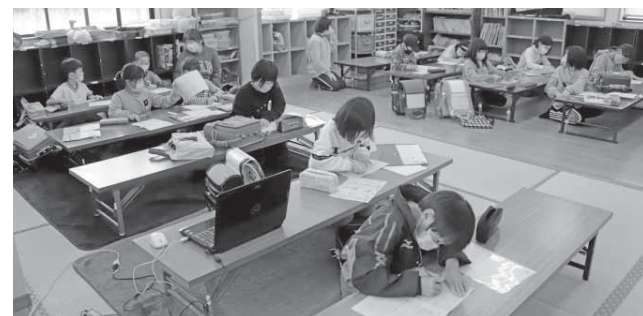
▲柱本地区学童保育所での学習の様子

……………2億5, 031万1千円 市内24カ所の学童保育所への運営費の補助金や、校舎から遠距離にある柱本地区学童保育所を校舎内に移設するための工事費などの予算を計上しています。