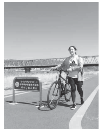
▲サイクリングロード (橋本橋付近)

……………166万6千円 サイクリングインストラクターを橋本市観光振興アドバイザーとして委嘱し、インスタグラムなどのSNSにより、サイクリングを通じて橋本市の魅力ある豊かな自然などを発信します。 また、橋本市を周遊できるサイクリングロードマップを作成する予算を計上しています。