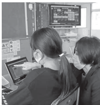
▲柱本小学校でのICT授業の様子

……………2, 481万6千円 GIGAスクール構想に伴い整備した端末により、オンラインで学習を進めることができる環境を整備します。 また、ICT支援員を各校に配置することで教員の負担軽減を行うとともに、効果的な活用を進めるための予算を計上しています。