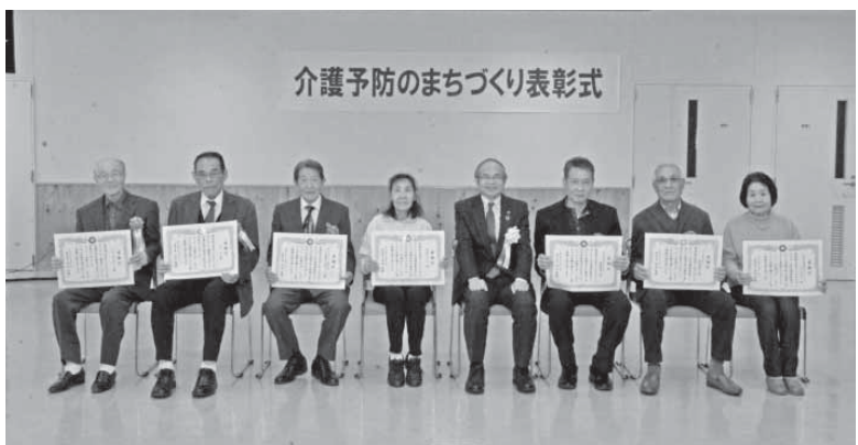
▲各団体の代表者の皆さん