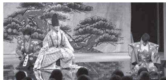
▲橋本狂言会による公演の様子

「幽玄の高野へ」では、橋本市で活動している「橋本狂言会」による市民狂言の発表、プロの演能集団「狂言古語美」による創作狂言「高野詣」を披露していただきます。