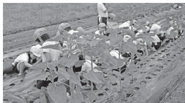
▲昨年度開催した白ゴマ栽培体験会の様子