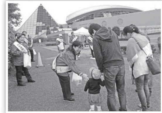
▲昨年(2020年)のまなびの日に行われた啓発活動の様子