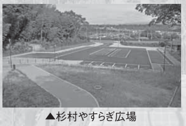
▲杉村やすらぎ広場

杉村公園の東側に整備を進めている杉村やすらぎ広場の駐車場の一部および多目的トイレ、多目的トイレ付近から杉村公園へつながる階段が利用していただけるようになります。遊具や芝生部分については、現在も工事のため、工事車両が通行しますのでご注意ください。 ● 利用開始日時 10月1日(木) 午前9時 ● 問い合わせ ● まちづくり課 ☎33-1179 ● 都市整備課 ☎33-6104