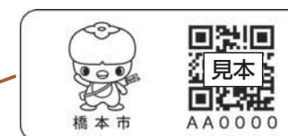
見守り安心シール (2.5cm×5cm)