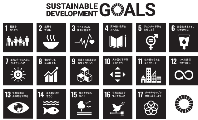
▲SDGsの全ての目標を表す17のアイコン

持続可能な開発目標 (SDGs) 消費者を取り巻く環境はめまぐるしく変化し、近年は、消費者一人ひとりが社会の動きに関心を持ち、自らの消費行動が世の中にとどのよう影響するかを考えなければならぬ時代になってきています。 持続可能な開発目標 (SDGs) が国連サミットで採択されてから4年が経過し、日本でもこの目標を意識した取組みが進められています。17個の目標のうち、12番「つくる責任、つかう責任」は消費者である私たちにかけられる目標といえます。