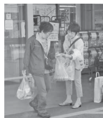
▲スーパーマーケットの店頭で街頭啓発

協議会では、普段から地域の見守り活動を行なっている人が異変や被害に気づいた際、専門の相談窓口である消費生活センターにつなぐための情報共有・支援を行います。地方公共団体や地域のさまざまな立場の関係者が連携し、消費者被害の未然防止・拡大防止を市内全域で進めます。