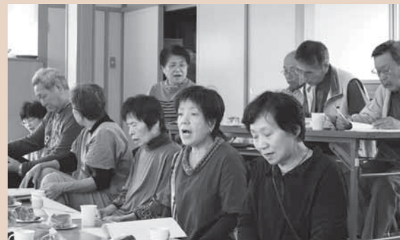
◀みんなで歌います