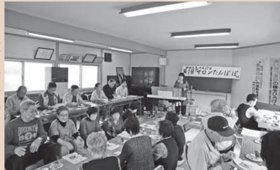
▶歌の先生を招いてレッスン