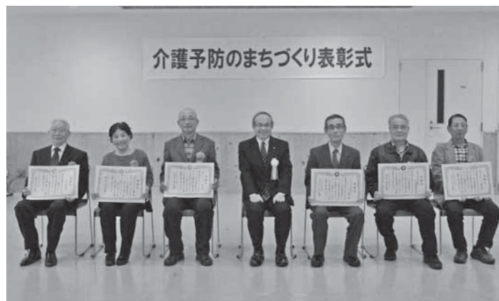
▲各団体代表の皆さんで記念撮影