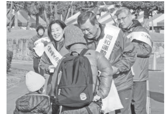
▲昨年（2017年）のまなびの日に行われた啓発活動の様子