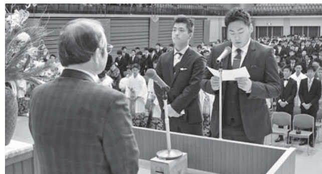
▲昨年の成人式の様子