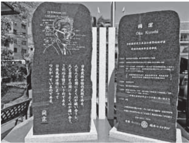
岡潔氏の記念碑（市役所前）

第16条 議員は、資質、政策形成及び立案能力の向上を図るため、研修と調査研究に努めるものとする。