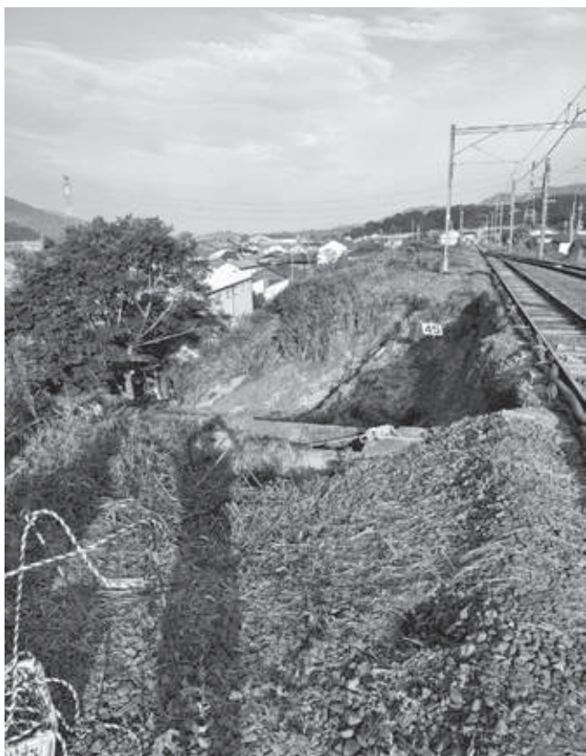
線路沿いの土砂崩れ(JR高野口駅付近)