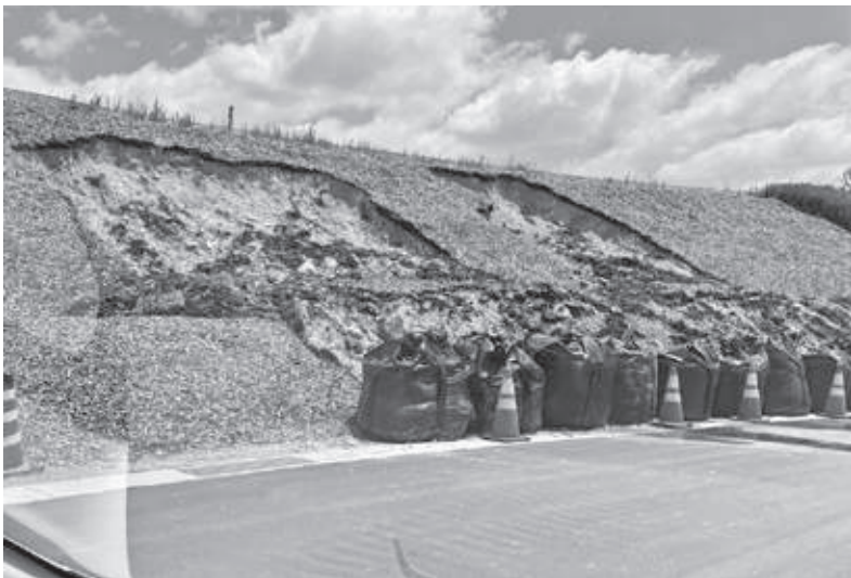
法面の崩壊(あやの台北部用地)