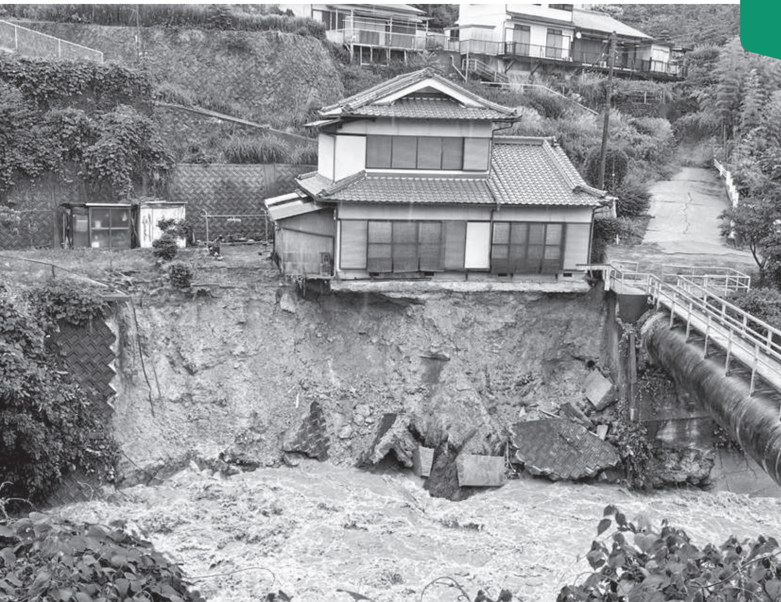
橋本川の増水による土砂崩れ(古佐田)

橋本市議会におきましても行政と連携しながら、一刻も早い復旧に向けて取り組みを進めています。