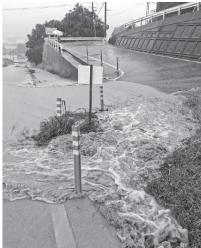
水路からあふれる雨水(清水)