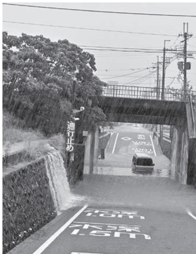
JR高架下の冠水(伏原)