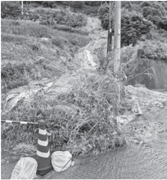
ため池の溢水による土砂崩れ(細川)