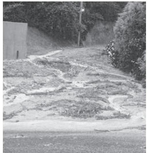
山からの土砂災害(三石台)