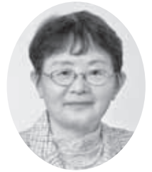
楠本知子 (公明党議員団)