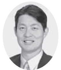
森下伸吾 (公明党議員団)