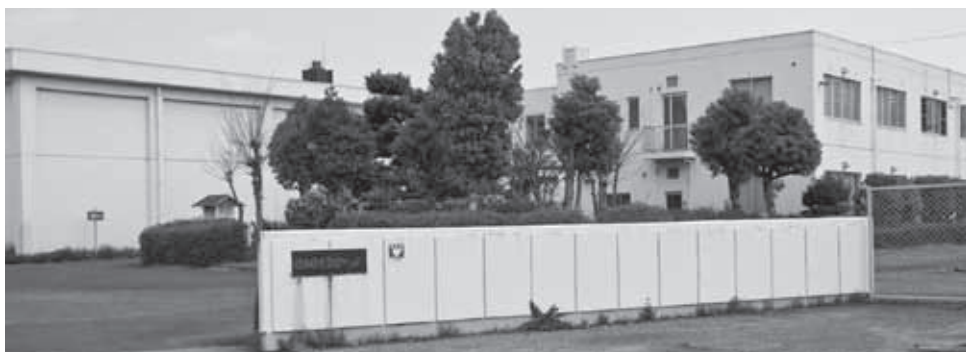
環境管理センター

橋本環境管理センターの操業延長にかかる橋本伊都衛生施設組合負担金の一部8,738万円については、組合の基金総額が1億3,000万円であるので、本来であればその範囲内での支出とすべきであり、設立当時と同じく学文路区と九度山町に同等の周辺整備をするべきだというならば、6,500万円ずつの金額が妥当であると考ええる。また、同センターの所在地であるにも関わらず、周辺整備に充当しない町の半額以下となることは到底理解しがたい。修正案を可決することで、