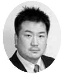
堀内 和久 議員