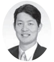
森 下 伸 吾 議 員