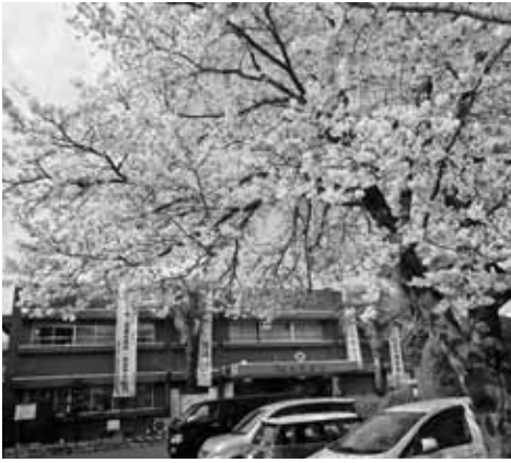
橋本市役所玄関前の桜