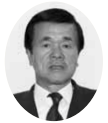
中本 正人 議員