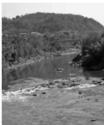
紀の川取水場付近

答 債務者の破産、死亡、行方不明など回収が見込めなくなった場合に限定して不能欠損処理をしています。25年度決算で使用料未収額は約1億3,300万円であり、そのうち26年3月末納期分が約9,800万円、過年度分は約1,700万円、2年前からの滞納は約1,000万円であり、過年度分については集金や分納誓約によって回収に努めています。