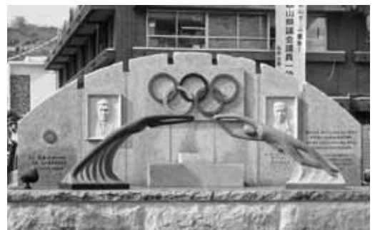
オリンピック金メダリスト 故・兵藤(旧姓・前畑)秀子氏 故・古川勝氏 顕彰碑(橋本ロータリークラブ建立)