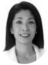
土井 裕美子 議員