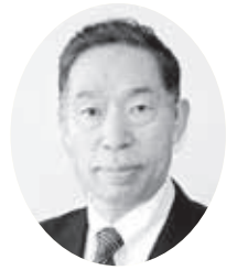
今 城 敏 仁 議 員