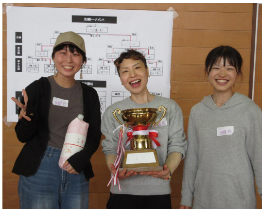
優勝は“つむじチーム”おめでとうございます！