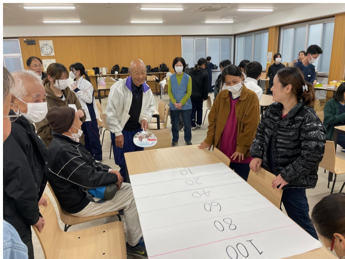
写真は前回開催のものです