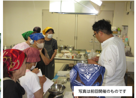
写真は前回開催のものです