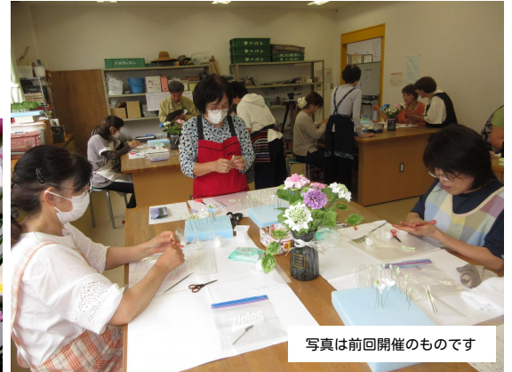
写真は前回開催のものです