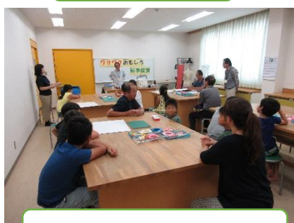
わくわくおもしろ科学教室