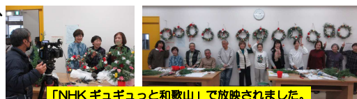
「NHK ギュギュッと和歌山」で放映されました。