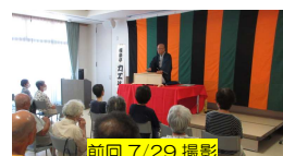
前回 7/29 撮影

笑いで楽しいひと時を！ 「落語は正面芸」とのこと。 当館の高座は座席から正面芸が見られる高さですよ♪