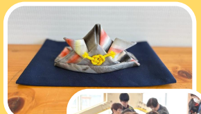
ものづくり& 体験コーナー