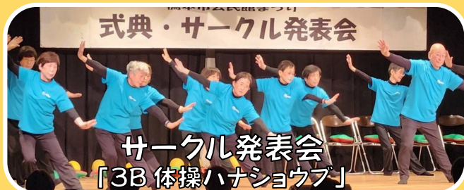
式典・サークル発表会

3月1日、2日に橋本市教育文化会館とその周辺で、第19回橋本市公民館まつりが開催されました。ご来場頂きました皆さん、ご参加頂いたサークルや地域の方々、スタッフとしてサポートして下さいました各地区公民館運営委員はじめ地域の方々、本当にありがとうございました。