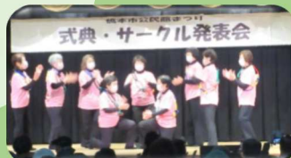
3B 体操ハナショウブさん