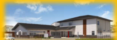
▲新紀見地区公民館イメージ

新しい紀見地区公民館(橋谷地内)の開館に向け、建設が進んでいます。 移転作業に伴い、現公民館(城山台地内)における貸館及び事業は、 3月31日をもって終了し、6月1日から新公民館にて再開する予定です。 ご理解ご協力をおねがいします。