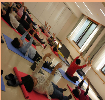
ヨガ de リフレッシュ