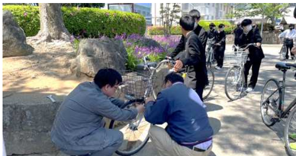
【念入りに自転車点検を実施】