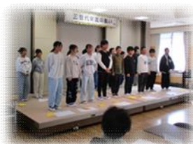
〈三世代交流の集い〉