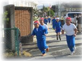
〈校内マラソン大会〉