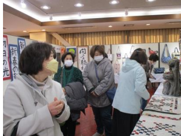
たくさんの方が観覧されました