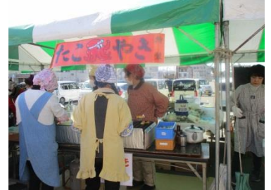
模擬店コーナー大盛況