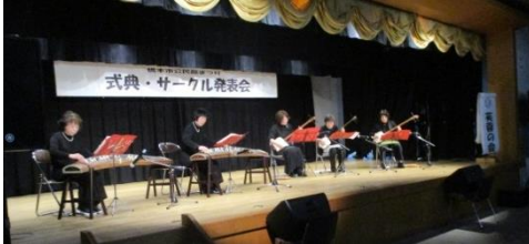
“六段の調べ” “ひなまつり”