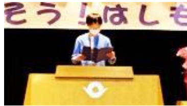
「話そう!はしもと」での6年生の発表