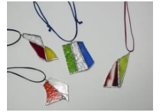
※見本は公民館にあります