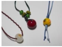
※見本は公民館にあります