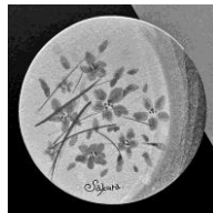
※見本は公民館にあります