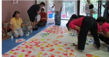
「手形アート」で大きなひまわりができました