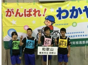
交通安全こども自転車全国大会出場