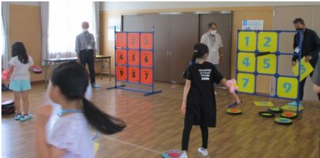
「ストラックアウト」