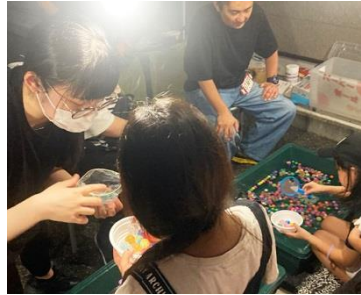
模擬店も楽しみました