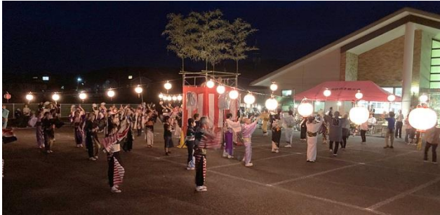
恋野の夜を舞いつくしました